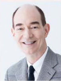
〔早稲田大学特命教授〕 ロバート キャンベル Robert Campbell