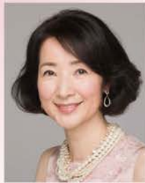
〔俳優〕 檀 ふみ Fumi Dan